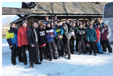
Účastníci lyžiarskeho a snowboardového výchovno-výcvikového kurzu 1. turnus

Kurzu sa zúčastnili predovšetkým žiaci prvého ročníka. Na záver kurzu všetci žiaci zvládli jazdu na vleku a na konci pobytu zlyžovali celý svah. Touto cestou sa chceme poďakovať našim pedagógom za krásne prežitý týždeň strávený s našimi žiakmi a za výbornú lyžovačku.