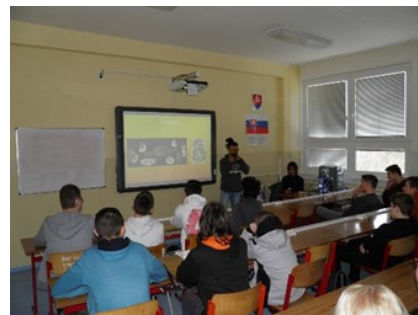
Vyučovacia hodina anglického jazyka vysokoškolských stážistov zo zahraničia