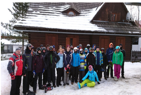
Účastníci lyžiarskeho a snowboardového výchovno-výcvikového kurzu 2. turnus

Súkromná stredná odborná škola polytechnická DSA v Nitre organizovala lyžiarsky a snowboardový výchovno-výcvikový